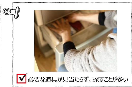
☑ 必要な道具が見当たらず、探すことが多い

そもそも、5S活動自体がマンネリ化しているのでは？ …実は、リーダーの思考が原因かもしれません。