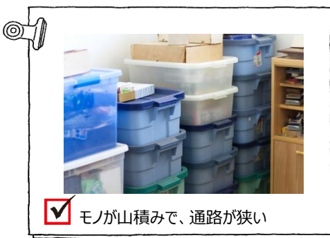
☑ モノが山積みで、通路が狭い