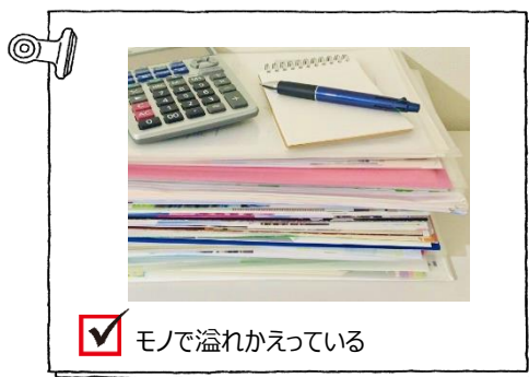
☑ モノで溢れかえっている